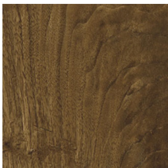
Black Walnut Herlev