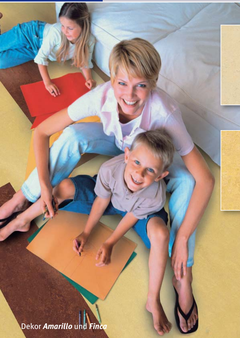
Dekor Amarillo und Finca